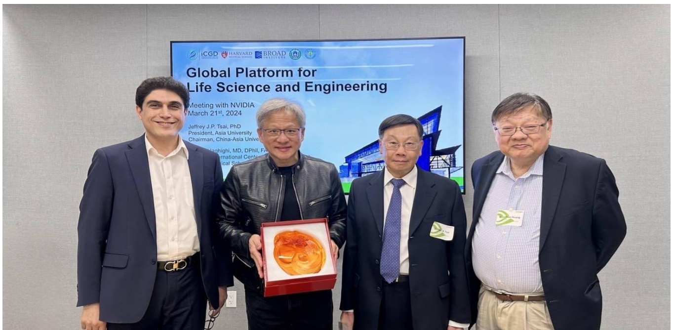
圖：亞大校長蔡進發（右 2）、美國哈佛大學醫學院 Alireza Haghghi 教授（右 4）、黃光彩講座教授（右 1），前往 NVIDIA 總部，與 NVIDIA 創辦人黃仁勳（右 3），針對智慧醫療領域深入交流。