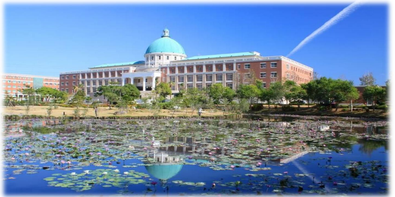
圖：就讀亞大，就是就讀一所「綜合大學」+「醫學大學」+「國際大學」