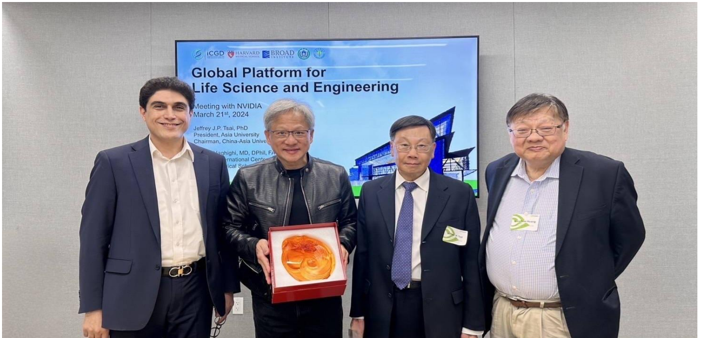
圖：亞大校長蔡進發(右 2)、美國哈佛大學醫學院 Alireza Haghighi 教授(右 4)、黃光彩講座教授(右 1)，前往 NVIDIA 總部，與 NVIDIA 創辦人黃仁勳(右 3)，針對智慧醫療領域深入交流。