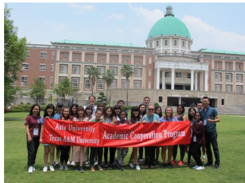
與美國德州農工大學進行國際師生交流

在學六年的時光中，因為系上多元化課程，讓我們依照自己專長和興趣增進自己的知識；系上豐富資源，也讓我們擁有更多學習的機會。很感謝師長培養我們國際視野，讓我們善用自己的優勢，提早面對未來職場生涯的挑戰及因應高齡化社會帶來的衝擊。目前已在長照領域服務約 9 年，歷經民間單位到政府部門後，決定獨自創業，投入第一線長照的服務，透過跨領域整合了長照及空間設計的專業，創立若晨室內設計工作室，期待能為台灣高齡產業做出創新的服務，也期許自己能擔任資源整合的平台，鼓勵新創團隊投入高齡產業的領域。