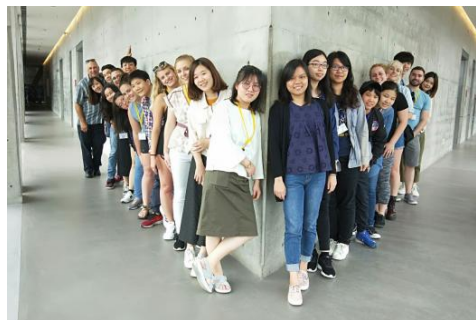
與美國杜蘭大學進行國際師生交流